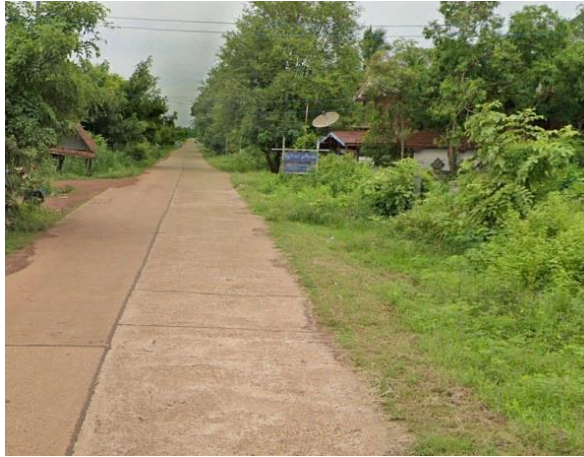
หลังดำเนินการ