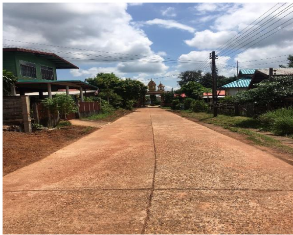
หลังดำเนินการ